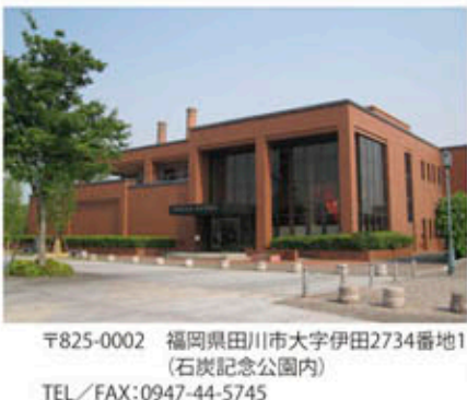
〒825-0002 福岡県田川市大字伊田2734番地1 (石炭記念公園内) TEL/FAX:0947-44-5745

第11回 TAGAWA コールマイน์・フェスティバル「炭坑まつり」今年で、11回目の開催を迎える「炭坑まつり」。毎年11月の第1日曜日とその前日に開催しており、今年も、11月5日（土）と6日（日）の2日間にわたって行われます。会場には、両日ともに多数の出店が軒を連ねており、田川の特産も味わえます。さらに、「炭坑節発祥の地」が誇る炭坑節の歴史や文化等を体感できるイベントも盛り沢山。炭坑節にまつわる歌と踊りの披露や炭坑節を新たな盛り付けで踊る創作炭坑節なども必見です。