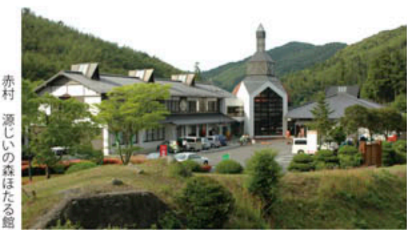
赤村 源じいの森ほたる館

や森林の散策等、自然を満喫できます。人気の温泉は大自然が生み出した良質な天然温泉で、周りに施した竹林がマイナスイオン効果と癒しを与え、豊富に湧き出る温泉には多数の効能があり、心身ともにリフレッシュできます。宿泊施設「ほたる館」では約100人規模のパーティーや同窓会など行うことができ、安心安全な地元赤村産の食材をふんだんに使った四季折々の料理を堪能することができます。 また、赤村で生産されている減農・無農薬の新鮮な野菜などを購入できる「赤村特産物センター」や観光列車として多くの観光客を集める「赤村トロッコ油須原線」等、赤村を満喫できる観光スポットもたくさんありますので、福岡にお立ち寄りの際は、ぜひ赤村へお越しください。