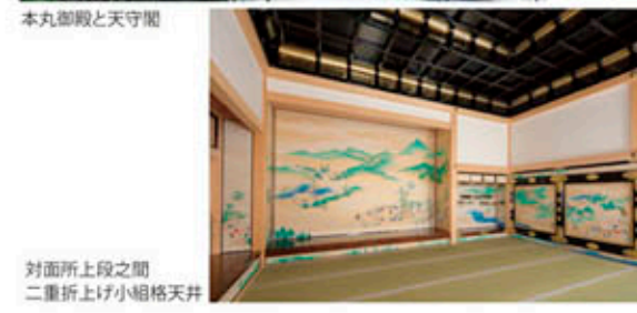
対面所上段之間 二重折上げ小榻格天井

今年6月から公開となった「名古屋城本丸御殿第二期公開 対面所・下御膳所」。 皆さん既にご覧いただけましたでしょうか。近世城郭御殿の最高傑作といわれた、名古屋城の本丸御殿は、昭和20年の戦災により焼失してしまいましたが、江戸時代の文献のほか、昭和に多くの写真、実測図が残されていたおかげで、時を越え江戸時代の姿そのままに復元が進んでおります。第一期工事で公開した「玄関・表書院」は、煌びやかな空間でしたが、今回公開された「対面所・下御膳所」は、藩主と身内などの内向きの対面や宴席の場であり、南側の2室には四季の風物や名所が多く、人物とともに描かれるなど、表書院とは違った雰囲気の一部屋となっております。大変見応えがあります。 名古屋が誇る本丸御殿へ是非お越しください。