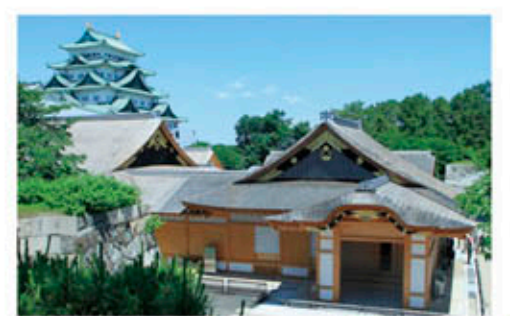
本丸御殿と天守閣