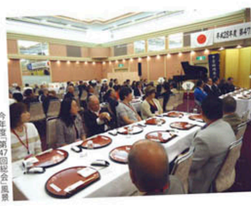
今年度第47回総会風景

日時/平成29年5月27日(土) 午前11時から 場所/ロースコートホテル 名古屋市中区大須四丁目9-60 ☎052-269-1811 地下鉄「上前津駅」1番出口傍 会費/5千円 参加資格/会員及び会員の推薦者並びに福岡県に興味ある方等