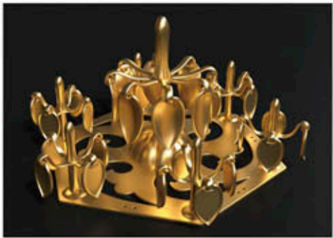
歩揺付飾金具復元CG

会や儀礼を考える上で、高い学術的価値があると評価されています。今回は古墳とこれに伴う遺構群が国史跡に指定されますが、今後は、出土品についても有形文化財として重要文化財指定をめざしていく予定です。 近い未来、この船原古墳遺物埋納坑を、市の宝として大切に保存し、皆さんが集まっていただける「古墳公園」に、との構想も練っていますので、来福の際はぜひ古賀市船原古墳へお越しください。