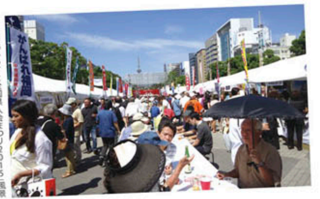
昨年開催された全国県人会まつり2015風景

日時/平成28年9月10日(土) 9月11日(日) AM 9:30 ~ PM 6:00 雨天決行 場所/久屋広場 名古屋市中区久屋大通公園内 ☎052-269-1811 地下鉄「天場町駅」1番出口傍 郷土芸能・特産品販売 観光PR ふるさと絵手紙コンテスト(全国から「ふるさと」をテーマの絵手紙募集) ユルキャラ大集合(各地の着ぐるみを集めたイベント) ふるさとグルメ自慢