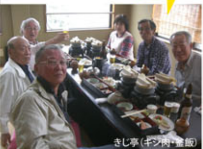
きじ亭(千手樹・龍飯)