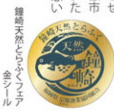
鐘崎天然とらふくフェア 金シール