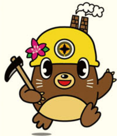
田川市マスコットキャラクター 「たがたん」

(本社) 448-0004 刈谷市泉田町下城120-3 TEL 0566-24-1129 FAX 0566-24-1429 携帯 090-3939-7462 E-mail: kurokenkouji@katch.ne.jp