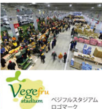
ベジフルスタジアム ロゴマーク

また、ベジフルスタジアムでは、毎月第3土曜日に「ベジフル感謝祭」を開催しています。季節の野菜・果物をお安く販売しているほか、市場見学会や、ベジフルクッキング（料理教室）も実施していますので、皆様ぜひ一度お越しください。