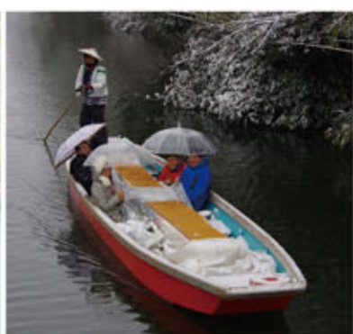
柳川市観光案内所 電話0944-74-0891 http://www.yanagawa-net.com