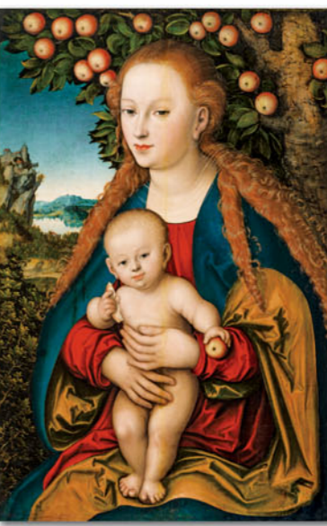
ルカス・クラナーナ 《林檎の木の下の子聖母子》 1530年頃 油彩、カンヴァス

◇会期 平成29年7月1日(土)～9月18日(月・祝) ◇会場 愛知県美術館(名古屋市中区:愛知芸術文化センター10階) ◇開館時間 午前10時から午後6時まで/金曜日は午後8時まで(入館は閉館30分前まで) ◇休館日 月曜日(ただし、7月17日(月・祝)、8月14日(月)、9月18日(月・祝)は開館)、7月18日(火) ◇観覧料 一般=1600(1400)円、高大生=1300(1100)円、中学生以下無料 ※()内は20名以上の団体料金 ◇お問合せ先 052-588-4466(中京テレビ放送 事業局) ホームページ http://www.ctv.co.jp/event/hermitage/