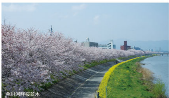
今川河畔桜並木 問い合わせ先 行橋市役所 総合政策課 企画係 ☎0930-25-1111(内線1421、1422)

の返礼品として解禁されます。この機会に、是非行橋市に関心を持って頂き、心温まる応援をお願いいたします。